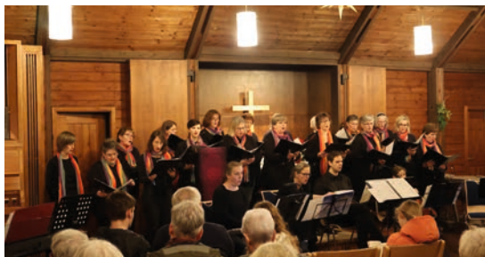
Das Konzert von Cantabella am Abend des 13. Dezembers 2025 war der Auftakt zum festlichen Jubiläumswochenende. Nach dem stimmungsvollen Beginn ging es mit außergewöhnlichen Liedern weiter.