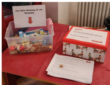
14 Stationen konnten die Kinder auf dem Gelände erkunden. Für jedes gab es dann eine kleine süße Belohnung.