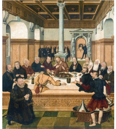
Ein Tisch-Abendmahl in der Kunst: Das Gemälde von Lucas Cranach dem Jüngeren (1565) zeigt, wie sich die führenden Vertreter der Reformation zu einem Abendmahl versammeln. Nur Judas ist separat dargestellt, er sitzt am Rand des Tisches, Christus reicht ihm etwas zu essen.