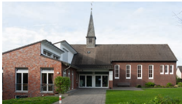
Das Gebäudeensemble der Evangelischen Christuskirche Olfen soll zukunftstauglich gemacht werden: in Zukunft eine multifunktionale Begegnungsstätte.