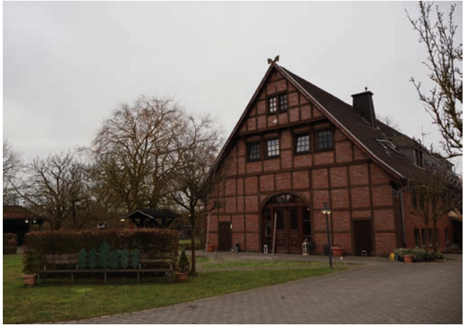
Es dient nicht nur einem sozialen Zweck, es ist auch ein Blickfang: das Hauptgebäude des Bauernhofs in Ascheberg. Das gesamte Gelände ist jedoch weitläufiger.

Traditionell singt unser Cantabella-Chor bei der Weihnachtsfeier von St. Georg in den Räumlichkeiten am Bahnhofsweg. Dabei erfreuen die Sängerinnen ihr Publikum immer wieder mit weihnachtlichen Liedern, unter denen sich auch ein paar Klassiker befinden. Auch unter den Klientinnen und Klienten gibt es ein paar Musikbegeisterte, die manchmal selbst zum Instrument greifen und die Lieder be-