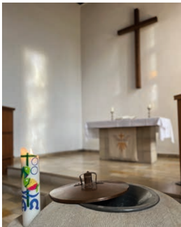
Das Taufbecken in der lichtdurchfluteten Martinskirche.