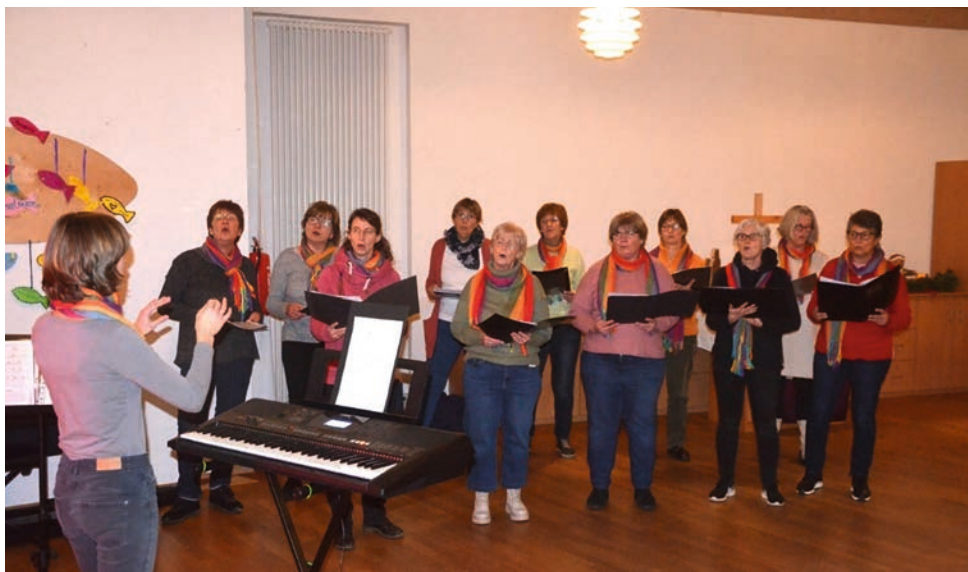
Der Cantabella-Chor bei den Proben im Gemeindehaus in Ascheberg.

Auf dem Bauernhof in Ascheberg gibt es mehrere Wohneinheiten für Menschen mit Behinderung oder Lernschwierigkeiten. In verschiedenen Außen-Wohngruppen leben Menschen, die weniger Unterstützung benöti-