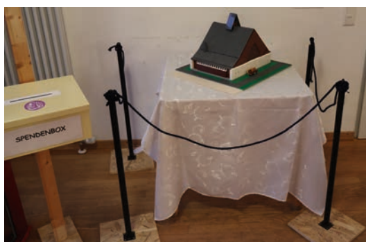
Das Lego-Modell der Gnadenkapelle diente als Blickfang am Eingang des Gemeindehauses. Und wer mochte, konnte gleich eine Spende dalassen.

Ein besonderes Highlight für die jungen Gäste war ein Quiz in Form einer Rallye. Mit detektivischem Spürsinn erkundeten die Kinder, aber auch deren Eltern den Kirchenraum, den Gemeindesaal und das Gelände. Ein herzlicher Dank geht an die benachbarte Mirjam-Kita, wo Kinder die Möglichkeit hatten,