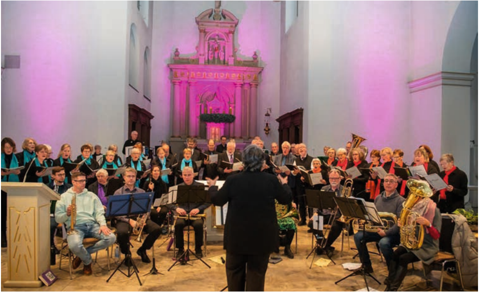
Der evangelische Posaunenchor spielt am 7. Dezember 2025, dem 2. Advent, zusammen mit dem Chor CONTACT sowie den Ludgeribläsers aus Münster.

vor Ort auf selbstverständliche Weise erlebbar.