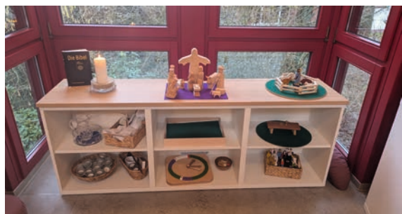
Noch befinden sich die Figuren und Materialien fein säuberlich geordnet im Schrank. Doch bald werden sie spielerisch zum Einsatz kommen.

Ein kleines Team startet dieses neue Format mit viel Freude und Neugier.