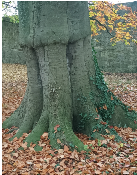
Ein Baum passend zu Methode und Ziel der Treffen: „Sich verwurzeln wie ein Baum mit der Erde und aufgerichtet zum Himmel.“